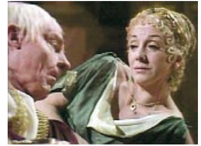
Fig. 4. Derek Jacobi (Claudio) e Barbara Young (Agrippinilla) in I, Claudius (1976).

pochissime scene in cui compare, la giovane Agrippina riceve un bacio assai poco casto dal fratello: una chiara allusione ai torbidi rapporti che intercorrevano tra i due (Fig. 3). Si tratta in ogni caso del primo film in cui vengono evidenziati, sia pure en passant , i tratti sensuali di Agrippina.