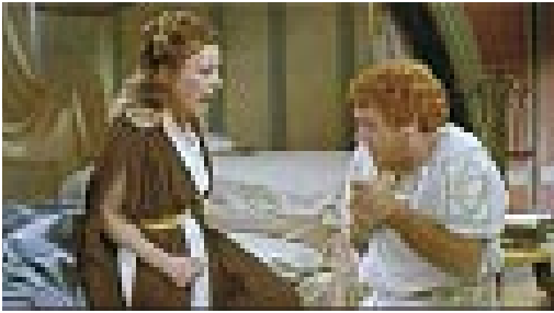
Fig. 2. Gloria Swanson (Agrippina) e Alberto Sordi (Nerone) in Mio figlio Nerone (1956).