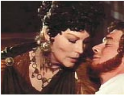
Fig. 8. Ava Gardner (Agrippina) e Anthony Andrews (Nerone) in A.D. Anno Domini (1984).